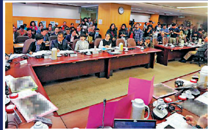
▲反中亂港分子騎劫區議會，甚至在會上集體合唱「獨歌」。