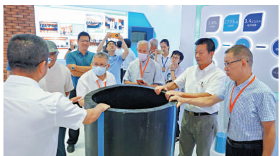
▲金門鄉親參觀金門供水工程所用管道。

「按照大陸的基建水平，往金門通氣、通電、通橋，技術上完全不是問題，主要障礙在於目前兩岸的政治氛圍。」董榮認為，「新四通」可參照供水管道開建海底隧道，將電路、氣路和交通通道合併同時施工，以節約成本。「只要前期規劃好了，時機成熟就可以拍板開建。民生問題解決了，其他問題都好談。」