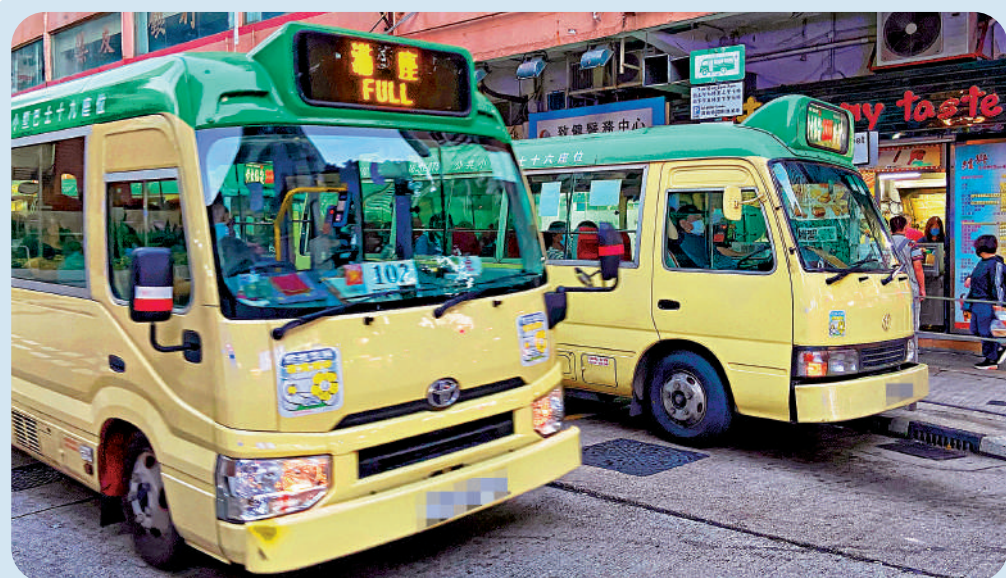
▲小巴商會預計業界輸入外勞司機，首輪只遞交約200個申請，遠低於政府提供的名額。