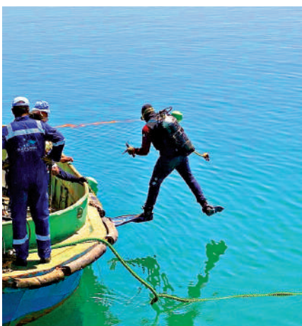
▲撞船事件發生後，蘇彝士運河當局派潛水員搜尋墮海的七名船員。