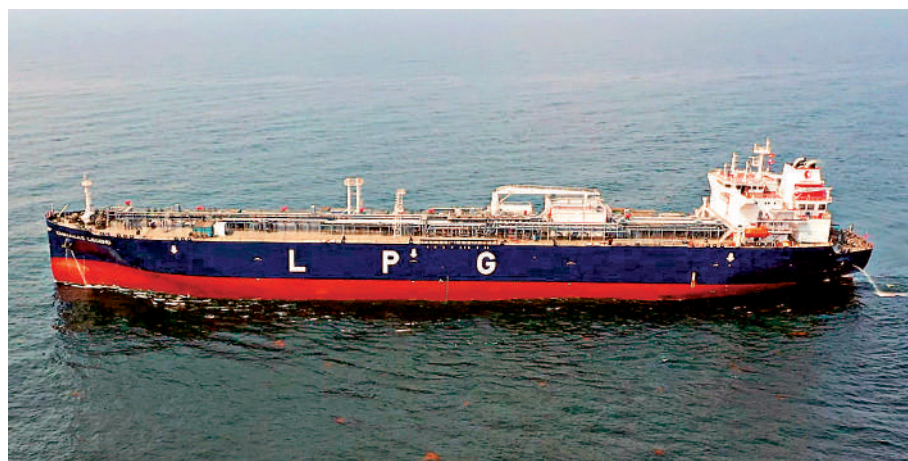
▲香港註冊、運載液化石油氣的「中燃傳奇」（上圖）在蘇彝士運河與一艘拖船相撞，拖船沉沒，一名船員身亡。