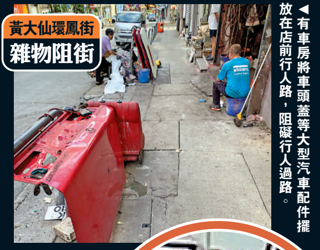
有車房將車頭蓋等大型汽車配件擺放在店前行人路，阻礙行人過路。