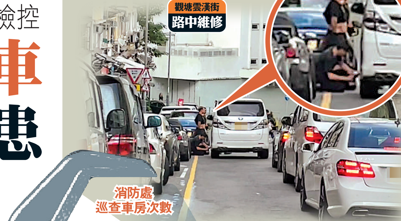
觀塘雲漢街 路中維修