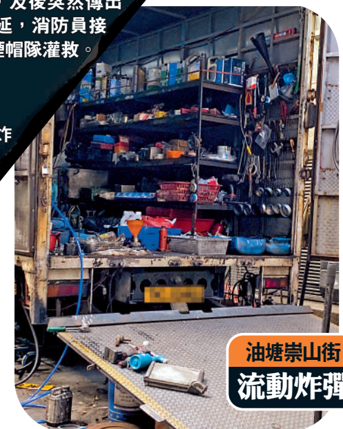
油塘崇山街 流動炸彈