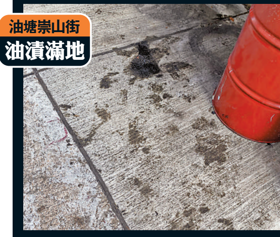
「修車檔」附近路面滿地油漬污垢，影響環境衛生。