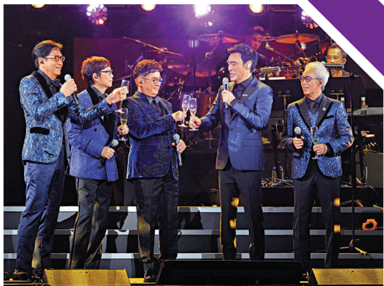
▲一曲唱罷，溫拿五虎感觸碰杯。

完成演出後，溫拿五虎接受訪問。問阿B其女兒鍾懿會否做歌手？他指女兒現在於英國修讀導演課程，要先完成學業。阿倫被問到為何不安排兒子上台表演？他笑說：「兒子有越洋看（演唱會），事業為重呀。」稍後，溫拿將赴大灣區內地城市乃至星馬等地演出。