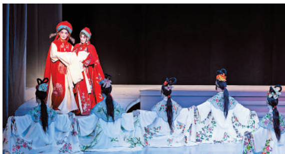
▲為了今次來港演出，劇院將十二花神的衣服全部翻新。

該劇從2003年開始排練，2004年首演，以融入現代美學的表達，對音樂、歌唱及舞蹈等多種藝術元素精巧整合，既保持了崑曲的詩意與精緻，亦表現了古典和現代相互交融的舞台場面，將崑曲之美展現得淋漓盡致。作品建基於原本的唱腔和傳統曲牌，繼承原詞，以「夢中情」「人鬼情」「世間情」為核心，於造型及技術上融入現代美