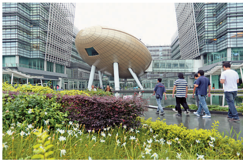
▲過去一年科學園與數碼港新增逾700間企業，港創科發展漸入佳境。

上述170億元的投資，相當於2800億元本地生產總值的6%，可產生一定拉動增長作用。事實上，目前當局正與更多海外與內地重點企業接洽，相信下半年會有更多公司在港開展業務。