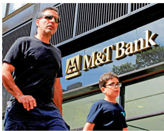
▲M&T Bank Corp等10間美國銀行被穆迪下調信用評級。

穆迪在另一通告也提到最新評級行動，指融資成本上升，銀行收入靈活性降低，最終會損害到盈利，難以抵禦虧損。