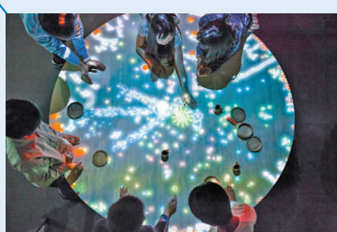
桌上的小人兒與參與者互動。