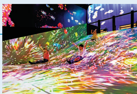
小朋友開心溜滑梯。

這個區域設置了3張桌子。每張桌子內都有小人兒居住。小人兒會在桌子裏不斷跑動，當參加者用手或其他東西放在桌子上時，會得到小人兒的注意並跳到桌上。根據物體的形狀，小人兒也會變換出滑行、跳躍和攀爬的姿勢。而放置的物品越多，越能讓小人兒玩得開心。