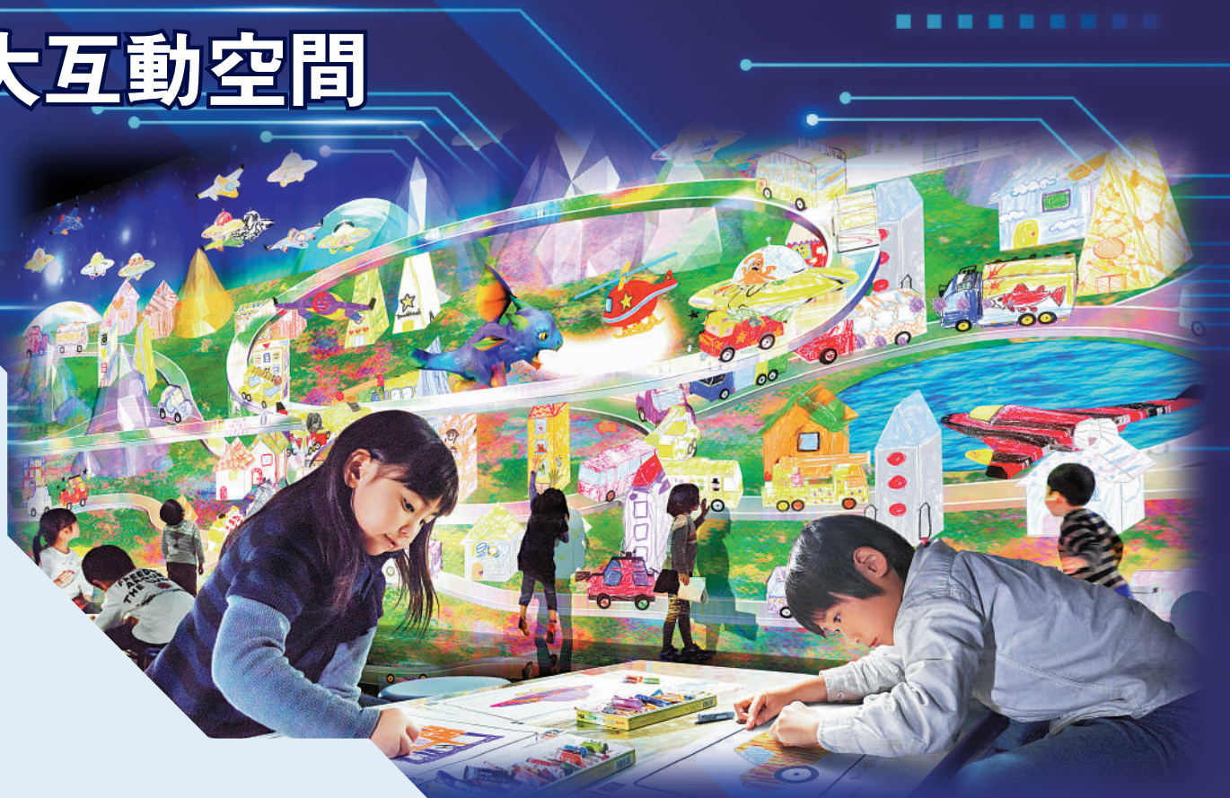
▲參與者為「彩繪城鎮」裏的物件畫圖。