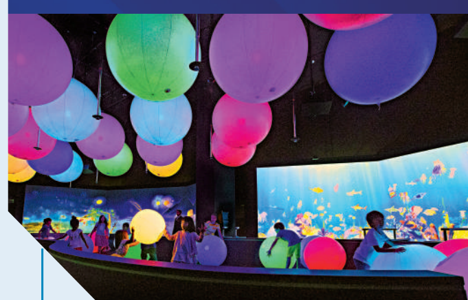
▲光球恍如「演奏」管弦樂。