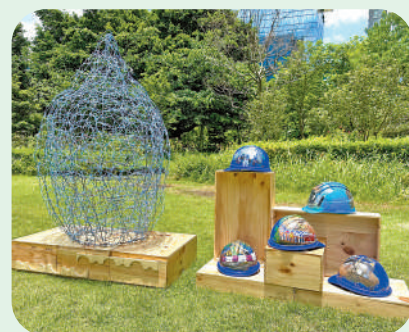
▲以環保回收物料創作的「水滴」與創意安全帽裝置。