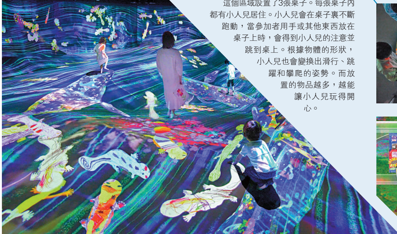
▲參與者在「流動」的山脈與山谷行走。

在這一空間內，會不定期有巨龍摧毀城鎮。而每一次摧毀後，參與者需要進行新的創作，來重新構建這一城鎮。