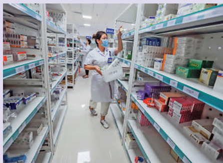
▲河北遵化市一家中醫院的藥劑師在藥房工作。

「醫藥代表曾一度被當作是『過街老鼠』，幾乎是人人喊打。」從醫專畢業後，曾短暫做過一段時間某醫藥企業