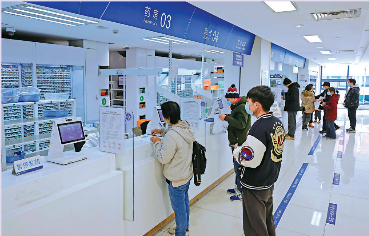
▲今年以來內地加強醫藥領域反腐，至今公開通報被查的醫院院長、書記達168人。圖為內地民眾在醫院排隊等待取藥。

此次醫藥反腐行動，以壯士斷腕、刮骨療毒之勢，向痼疾開刀，聚焦「全領域、全鏈條、全覆蓋」的系統治理，貫通藥品的生產、銷售、採購、臨床使用等。重拳打虎拍蠅是手段，更重要的是能夠根除「病灶」，改革一些監督機制「牛欄關貓」，不夠細化、難以有效落實的問題，切實紮緊制度籠子，掃除尋租空間和灰色地帶。這對於澄清吏治、改善民生福祉、優化相關產業發展，將是一舉多得。