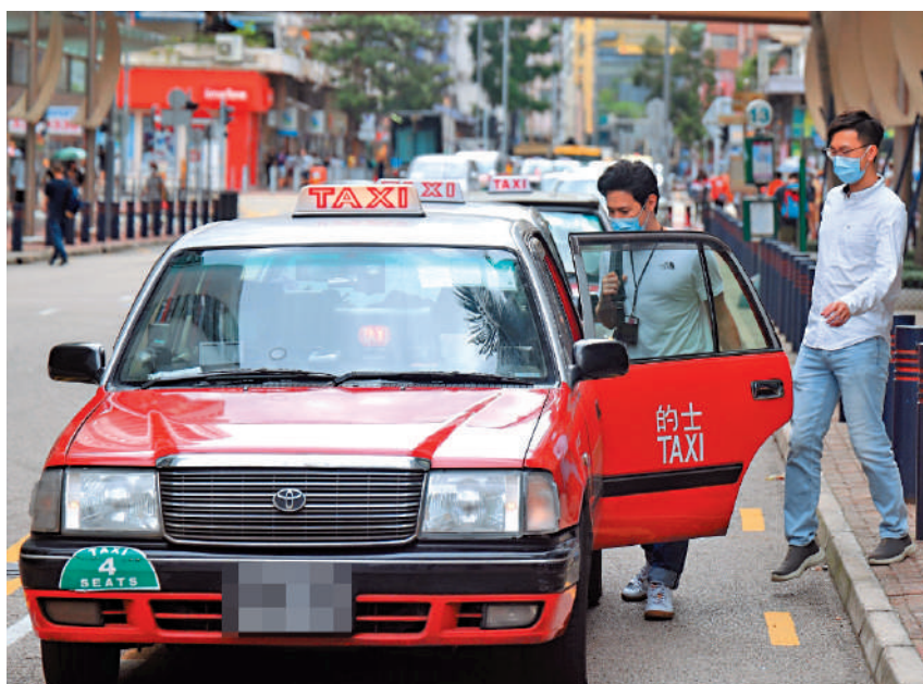
▲針對有的士司機濫收車資或拒載揀客，業界建議修例，容許警方透過簡易治罪條例發出告票。