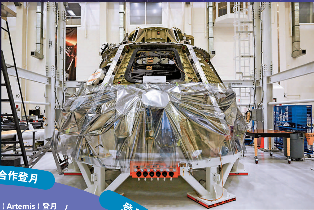
▶美國「阿爾忒彌斯3號」登月計劃的乘員艙。