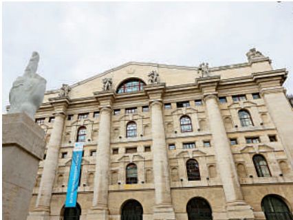
▲意大利政府8日宣布對該國銀行徵收一次性40%的暴利稅。

行的加息決定，由於利率上升增加了貸款收入，意大利銀行上半年利潤出現大幅增長。美銀預計，新的暴利稅