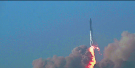
▲今年4月20日，SpaceX的星艦在發射後不久就發生爆炸。

2020年4月30日，NASA選定「星艦」作為「阿爾忒彌斯3號」載人登月任務的月面著陸航天器，合同價值29億美元。但是，「星艦」至今距離準備就緒仍有一段距離，且「星艦」4月20日在得州的首次軌道試飛行動以爆炸收場。「星艦」當天點火升空後約4分鐘突然爆炸，未能加速進入預定軌道，最後墜落墨西哥灣。馬斯克團隊稱，未來數月會再進行試射。