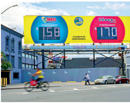
▲佛州一名男子獨攬「超級百萬」15.8億美元頭獎。

萬」彩票時分兩個區選號碼，一區號碼要從1至70號中選出5個數字，二區號碼從1至25中選擇1個數字，兩區號