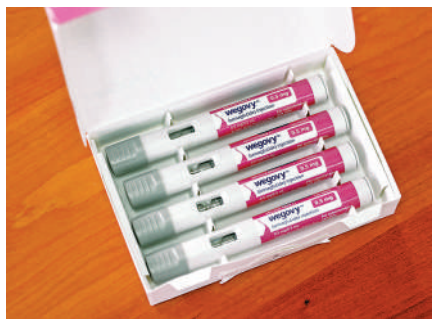
▲新款減肥藥Wegovy注射筆。

藥廠自2018年開始進行這場大規模臨床實驗，有17604名45歲以上有心臟病史、但無糖尿病史的過重或肥胖人士參與，結果顯示，使用Wegovy的病患出現心臟病或中風等心血管事件的幾