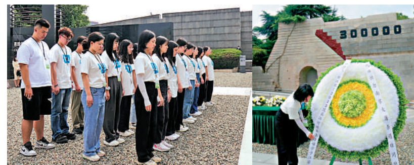
▲蘇港兩地學子向南京大屠殺遇難同胞默哀，並向南京大屠殺遇難同胞敬獻花圈。

• 泰州市是承南啟北的水陸要津，為蘇中門戶，自古有「水陸要津，咽喉據郡」之稱。700多年前，馬可·波羅遊歷泰州，稱讚「這城不很大，但各種塵世的幸福極多」，泰州是國家歷史文化名城。