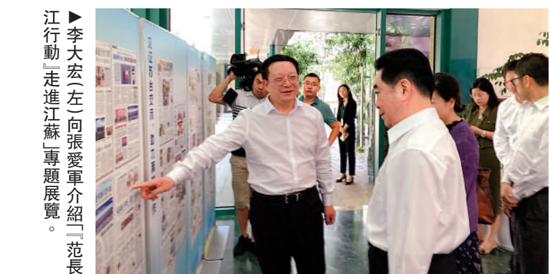
江蘇行「走進江蘇」專題展覽。

本次「江蘇行」採訪團成員來自香港理工大學、香港浸會大學、培僑中學、劍橋大學、南京大學等大中院校。