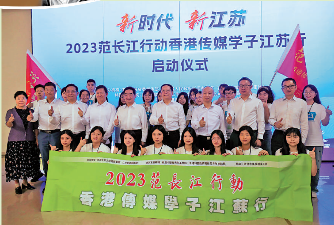
動9日在江蘇南京啟動，參加啟動儀式的嘉賓和採訪團成員合影。

由香港大公匯傳媒集團、中共江蘇省委宣傳部、江蘇省人民政府新聞辦公室共同主辦的「新時代 新江蘇——2023范長江行動香港傳媒學子江蘇行」活動，8月9日在南京雞鳴山麓的「世界文學客廳」啟動。來自香港和南京的24名學子將以實習記者身份，實地領略和深入採訪江蘇厚重的歷史文化以及經濟社會發展亮點。江蘇省委常委、省委宣傳部部長張愛軍和香港大公匯傳媒集團董事長、總編輯兼大公報社長、香港文匯報社長李大宏為採訪團授旗。