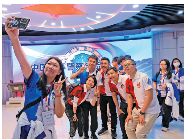
▲東九龍「青興計劃」暨東九龍少年警訊上月赴遼寧考察交流，其間參訪刑事警察學院、科研公司及歷史博物館等，加強青少年的國民身份認同及愛國情懷。

【大公報訊】記者古倬勤報導：東九龍「青興計劃」暨東九龍少年警訊上月21日至28日赴遼寧考察交流，其間參訪科研公司、刑事警察學院及歷史