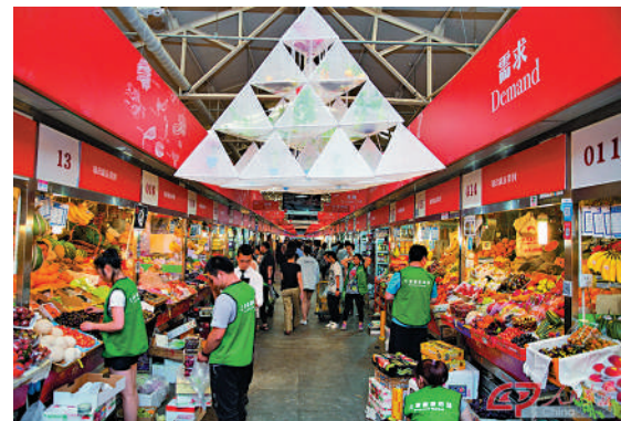
▲位於北京使館集中區的三源里菜市場可以品嘗五湖四海的美味。

市井長巷就是最近的遠方。一處菜市場，囊括着四海之味、八方美食，暗藏着江南和塞北的相遇、東方與西方的碰撞。」誠如網友所說，小小菜市場，不僅有三餐四季，更體現着一種生活方式。特別是在緊張的都市生活節奏中，逛一逛菜市場，很快就能讓人的身心放鬆下來，讓生活的轉輪得到片刻的休歇。