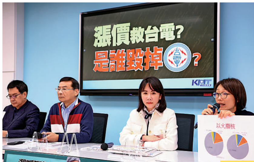
▲中國國民黨黨團召開記者會，批評民進黨當局錯誤能源政策導致台電虧損擴大。中央社 ▶台電今年底累計虧損將達4675億元新台幣，預計明年將因資不抵債而破產。圖為台電工作人員在抄電錶。資料圖片

【大公報訊】據台媒報道，由於國際燃料價格居高不下和電價始終不能充分反映發電成本，台灣電力公司（下稱「台電」）的虧損不斷加劇，瀕臨破產邊緣。為此，台經濟部門將撥款1000億元（新台幣，下同）對其進行搶救。島內輿論批評，民進黨當局「非核家園」錯誤政策導致台電虧損，現在卻要全民埋單。有大陸學者認為，台灣擺脫能源困境的最佳出路是將電網併入大陸電網，從根本上改變電力體系脆弱的結構性困境。