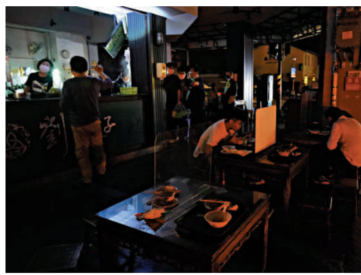
▲去年3月全台大停電，外出用餐民眾在戶外桌椅摸黑吃飯。資料圖片