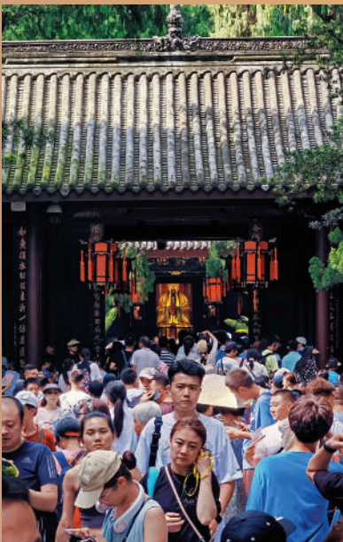
▲武侯祠博物館每年吸引眾多喜歡三國文化的遊客前來參觀。