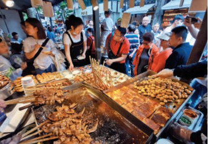
▲寬窄巷子中的小吃誘人。

其中，寬巷子是「閒生活」的懷舊之處，遊客可以愜意地喝蓋碗茶、熱火朝天吃火鍋、聽幾十年前的老成都人擺龍門陣、觀繡蜀錦、看皮影戲和木偶戲等，老成都市井民俗和風土人情都在這裏一一展現。窄巷子則是「小資」情調的延長線，這些院落裏大多是頗有