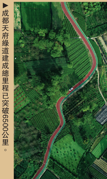
▲成都天府綠道建成總里程已突破6500公里。