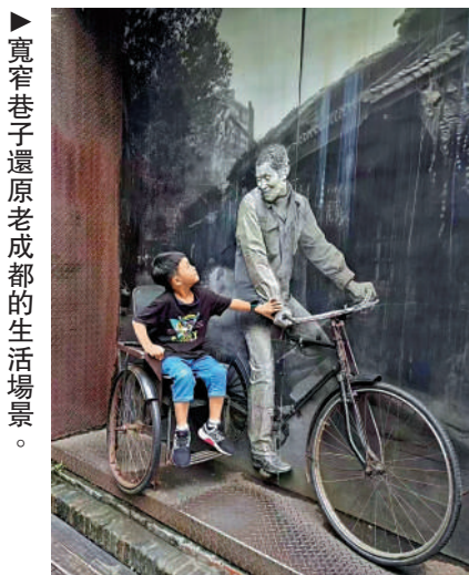
▲寬窄巷子還原老成都的生活場景。

明德胡同。辛亥革命後，滿城城牆被拆除，一些達官貴人來此建公館、住宅，蔣介石也曾經來過，使得這些古老的建築得以保存下來。民國初年，當時的城市管理者下文，將「胡同」改為「巷子」。