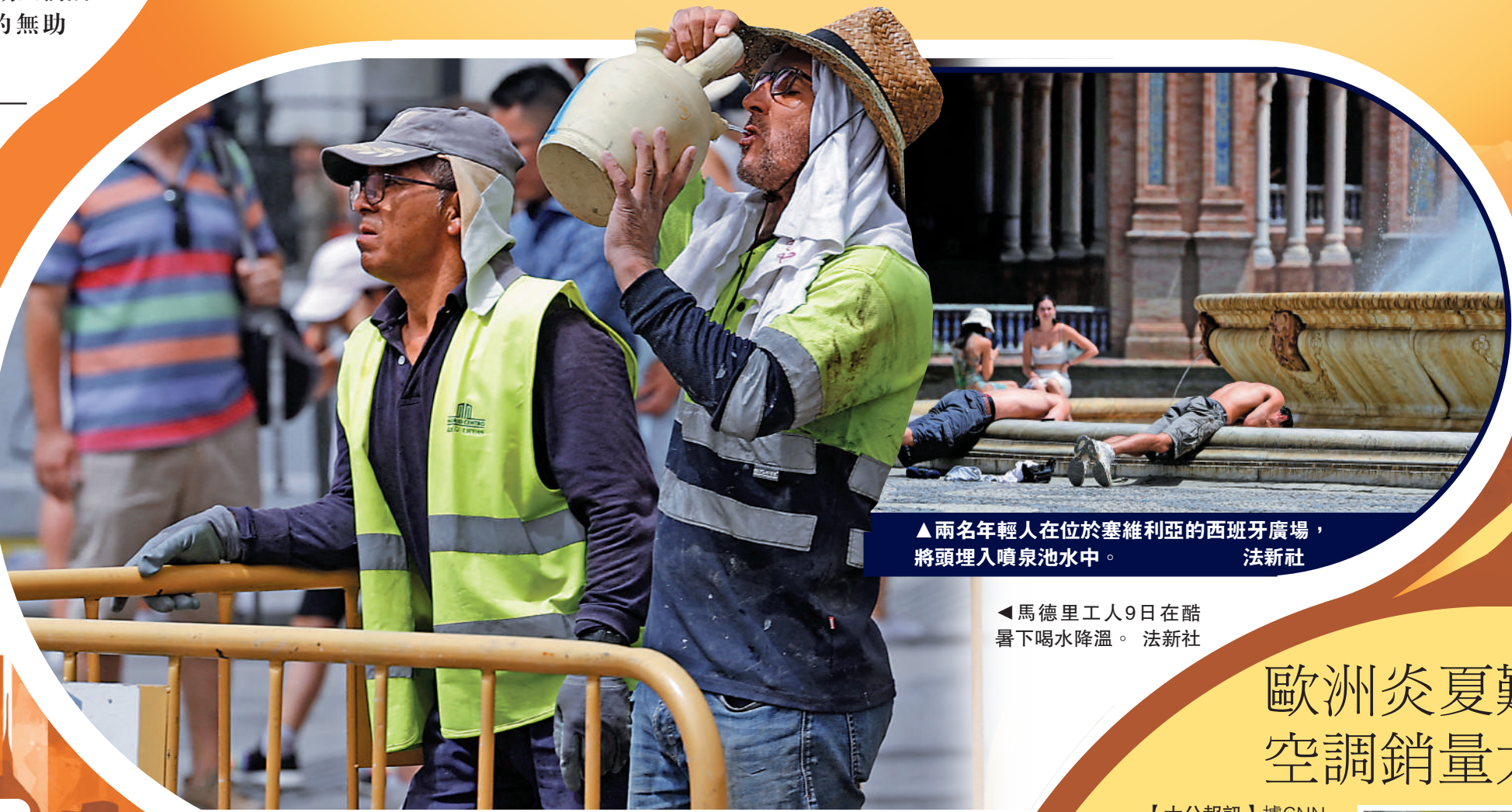
▲兩名年輕人在位於塞維利亞的西班牙廣場，將頭埋入噴泉池水中。