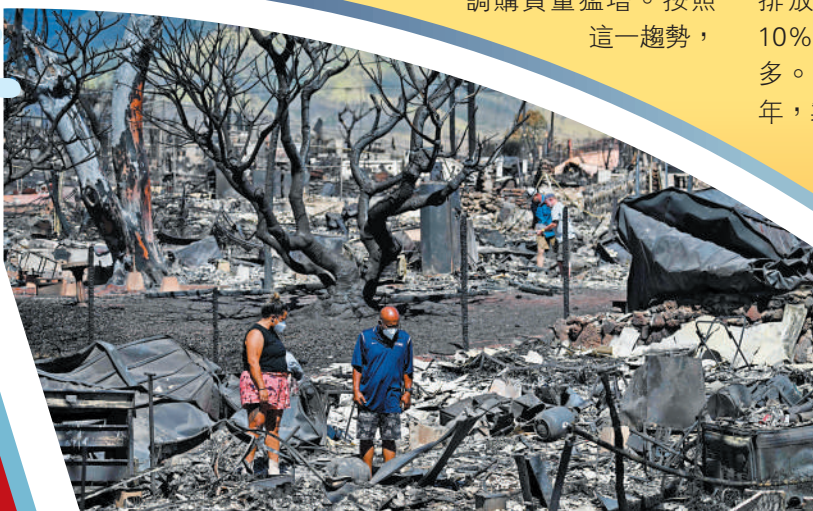
▲拉海納居民11日在自家房子的灰燼中尋找物品。

國佛州的橙子大幅減產。美國農業部估計，全美橙子產量將下降25%以上，減至230萬噸，是56年來的最低水平。橙子產量預計會減少近一半，降至8.5萬噸，創歷史新低。9月交割的橙汁商品期貨價格10日達到每磅3美元以上，比一年前高出1美元多。