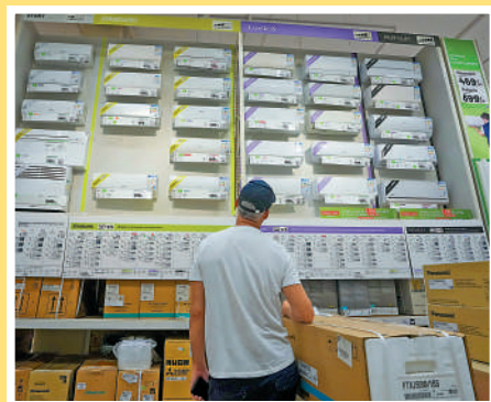
▲羅馬一名男子在百貨商場選購空調。

北半球近年夏季不斷受到熱浪侵襲，氣溫屢創新高，這讓歐洲人轉變了此前的態度，紛紛購置空調。根據氣候數據公司Kayrros的數據顯示，今年的極端高溫使得法國和英國的空調購買量猛增。按照這一趨勢，