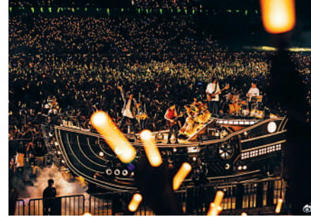
▲7月7日，五月天演唱會在深圳大運中心體育場舉辦，現場人山人海。

伍廣州演唱會門票時的場景。但在當下的演唱會市場，這些搶票準備實在過於「簡陋」。有「行家」透露秘訣：搶票前應先清退手機後台運行的所有軟件；使用搶票軟件APP通常比小程序更穩定等等。更有人使出「鈔能力」，花幾百上千元請專人代搶。