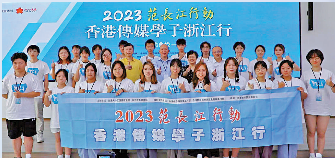
▲「2023范長江行動——香港傳媒學子浙江行」圓滿結業，24名香港學子實地感受詩畫江南的別樣魅力。