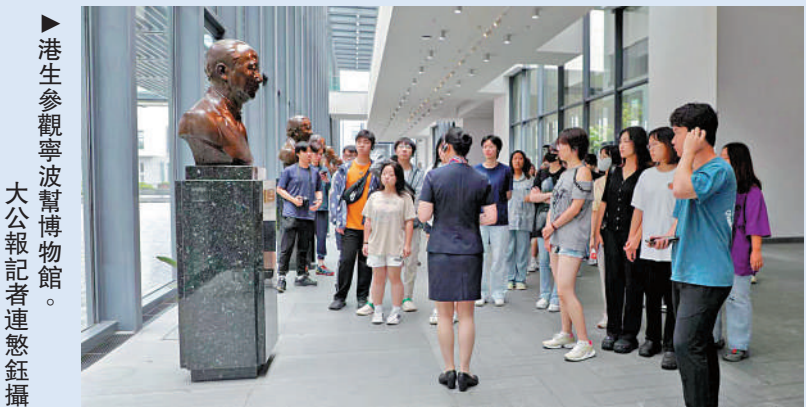
港生參觀寧波幫博物館。