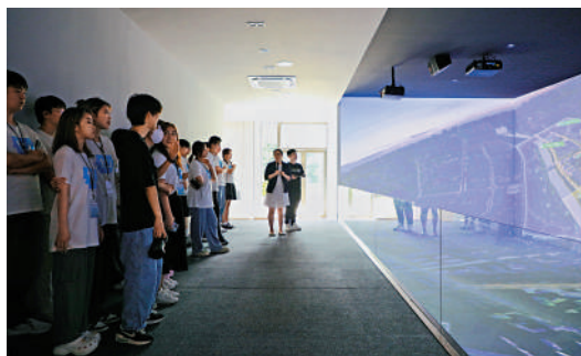
▲香港學子參觀了解杭州運河財富小鎮發展規劃。

「京杭大運河沿線自古以來便是商賈雲集之地，千年古運河可以說孕育了中國南北千年的商脈。我們這座坐落於運河邊的財富小鎮，目前已入駐400多家來自全球的金融企業，很多企業都向我們提出希望能夠招引國際化的人