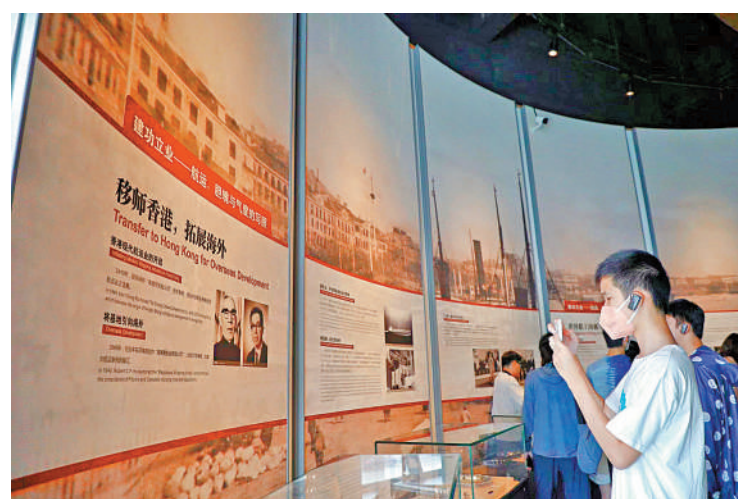
香港學子在寧波幫博物館了解「寧波幫」與香港的故事。大公報記者連愷鈺攝