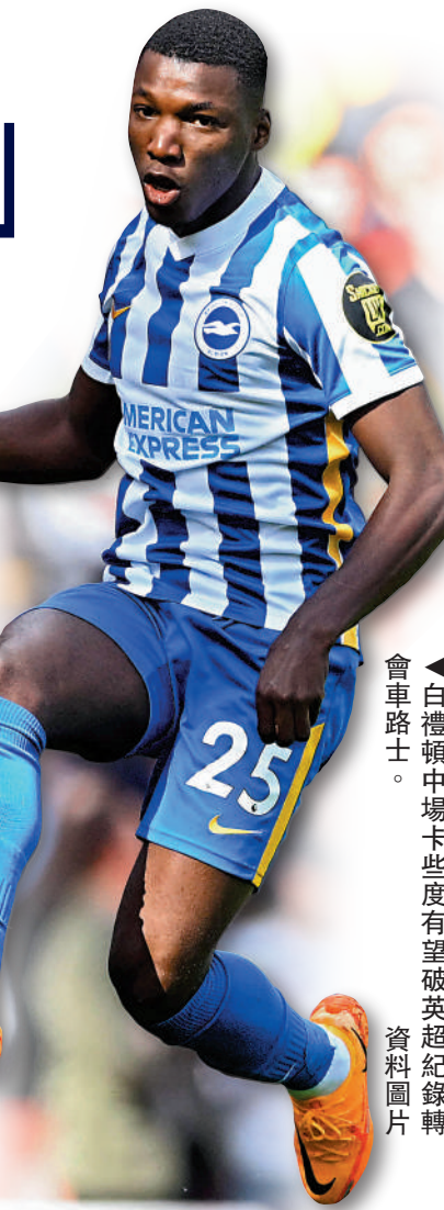
▲白禮頓中場卡些度有望破英超紀錄。