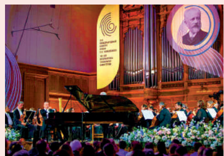
▲劉詩昆在第17屆柴可夫斯基國際音樂比賽開幕式上演奏。

劉詩昆畢業於莫斯科音樂學院，又先後跟隨蘇聯專家塔圖良、克拉芙琴柯、法因伯格等老師學習，他的彈奏具有典型的俄派鋼琴風格，剛強、樸實、大氣，充滿了生命力。