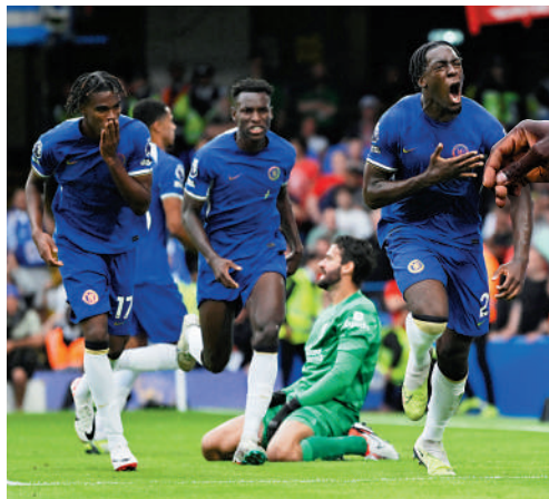
▲車路士新中場摩西卡些度射入扳平球。