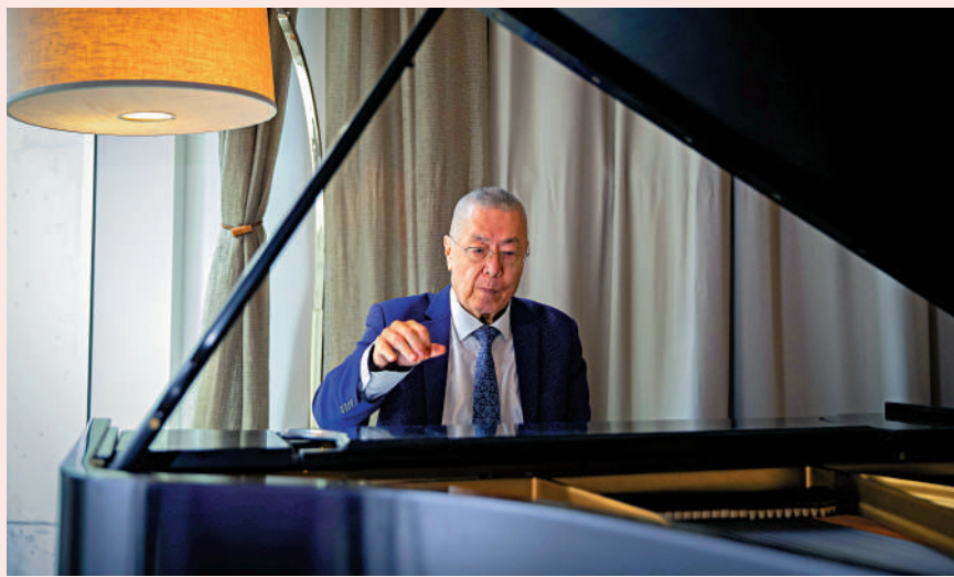
▲劉詩昆獲第40屆亞洲最傑出藝人終身成就獎。

劉詩昆表示，音樂能給世界帶來美好與溫暖，中美兩國音樂家們將繼續保持交流，他本人也將為發揮音樂的特殊作用而更加努力。當天，劉詩昆即興演奏了中國歌曲《祖國頌》和美國歌曲《美麗的亞美利加》，後者是美國前總統尼克松當年訪華時中方在歡迎晚宴上演奏的樂曲。