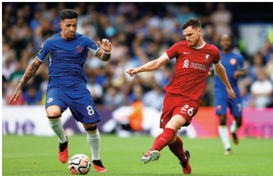
▲車路士貴價兵安素費南迪斯表現不俗。

相反，利物浦一如所料中場逼搶能力仍然不足，穆罕默德沙拿被換出時更大發脾氣表達不滿，加普表現低沉，後備的連雲紐尼繼續是「浪費機會主義者」，暫時並沒有樂觀的本錢。