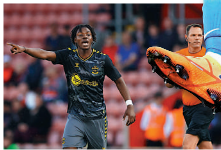
▲拉維亞（左）對加盟利物浦不太感興趣。資料圖片