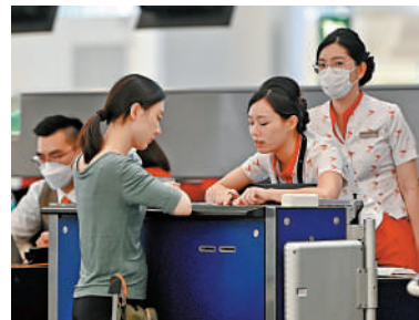
▲航空業輸入外勞首輪，以地勤人員最多。逾二千八百個配額，以獲批逾二千八百個配額。

第一輪申請期內有29間合資格公司申請共2889個輸入勞工配額，涵蓋所有10個工種。經運輸及物流局、勞工處、機場管理局組成的跨部門聯絡小組審批後，運輸局常任秘書長決定批准28間公司、共2841個配額，約佔配額上限45%。當中地勤人員獲批出719個配額，數量最多；其次是機坪服務