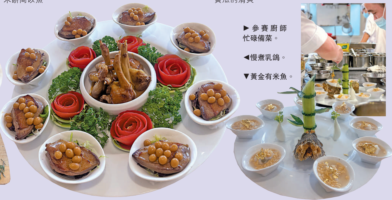
▶ 參賽廚師忙碌備菜。