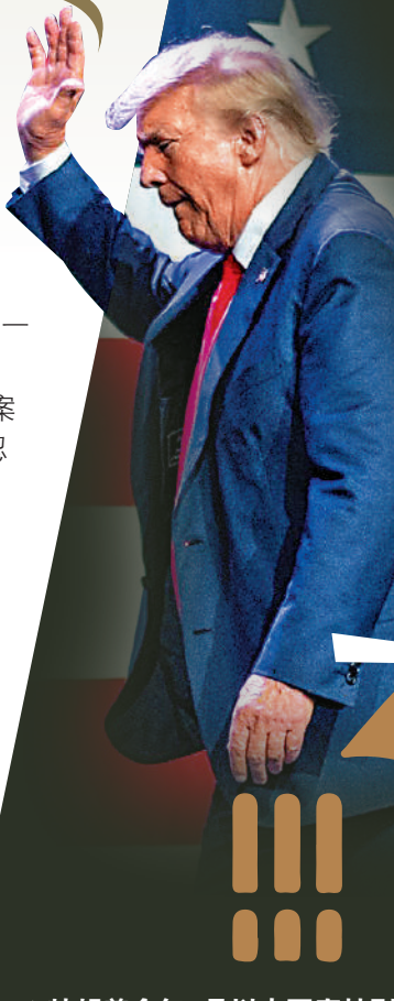
▲特朗普今年3月以來四度被刑事起訴。

違反佐治亞州《反敲詐勒索及腐敗組織法》(RICO)、3項教唆公職人員違反誓言、串謀冒充公職人員、2項一級串謀偽造、2項虛假陳述、2項串謀虛假陳述、提交虛假文件、串謀提交虛假文件等，其中RICO允許檢察官將由不同人犯下的罪行串聯起來，以證明他們有共同目標，這項指控的刑罰相當嚴厲，通常用於起訴黑幫頭目。大公報整理