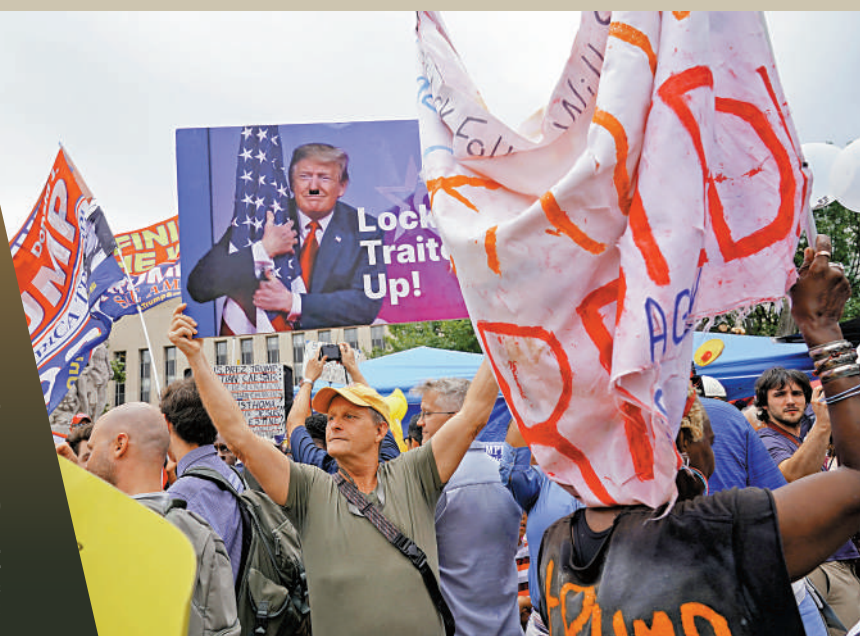
▲特朗普的反對者3日在美國聯邦法院附近示威。