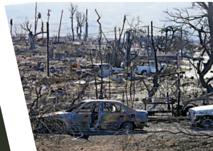
▲毛伊島拉海納市大量房屋和汽車被燒毀。

毛伊島上歷史悠久的度假城市拉海納幾乎被大火吞噬，該市880公頃土地被燒毀。聯邦緊急事務管理局估計，重建該市將花費55億美元。據美國國家消防協會稱，毛伊島大火是自1918年以來美國最致命的山火。