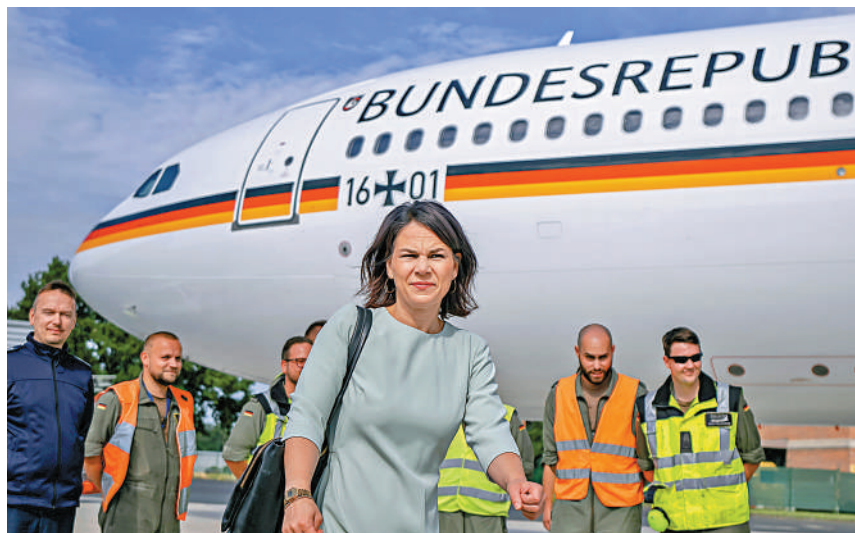
▲德外長貝爾伯克14日因專機故障被困阿聯酋。圖為貝爾伯克上月搭乘專機抵達波恩。美聯社

【大公報訊】綜合路透社、美聯社、《金融時報》報道：當地時間14-15日，德國外長貝爾伯克乘坐的政府專機兩度出現技術故障，被迫返回阿聯酋阿布扎比機場。貝爾伯克隨後宣布取消原定一周的「印太之行」。德國政府專機多次發生故障，官員深受困擾。英媒指出，此類事件引發外界對德國「工業大國」地位不再的擔憂，以及對國防軍工甚至軍隊備戰狀況的質疑。