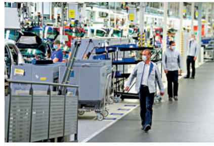
▲德國沃爾夫斯堡汽車工廠的工作人員佩戴防護面具作業。

轉往北美和亞洲等地區，尋求新發展。德國政府專機頻出故障，進一步說明了德國工業空心化進程積重難返。