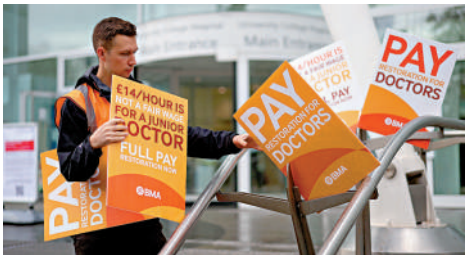
▲英國政府財困通過BNO簽證申請斂財。圖為醫護人員14日在倫敦示威要求加薪。

式」，更諷刺當局有資金與人員推出這項政策，卻不肯「更快地處理難民申請」。根據英國內政部在5月公布的數字，今年第一季有9411宗BNO簽證申請。