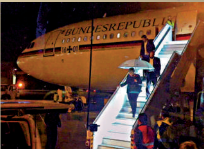
▲2018年11月29日，前總理默克爾的專機因嚴重故障緊急迫降。