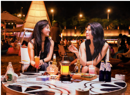
▲人們在江蘇連雲港在海一方公園品嘗美食，夜間消費火爆。