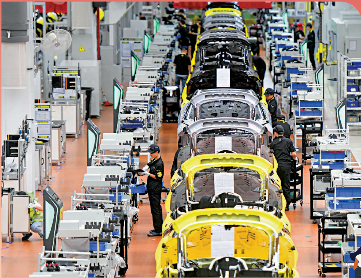
7月國民經濟持續穩定恢復

針對下階段經濟走勢，付凌暉表示，世界經濟仍面臨下行壓力，國內經濟恢復面臨需求不足，結構性矛盾與周期性問題交織等制約。但國內市場潛力大、產業基礎雄厚、發展空間廣闊等優勢明顯，長期向好的基本面沒有改變。隨着經濟內生動力的增強，宏觀政策調控力度加大，經濟有望持續恢復向好，「下半年經濟有望保持平穩運行，發展質量繼續提高。」