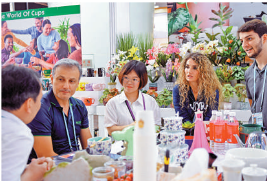
▲在第133屆廣交會二期展會現場，外籍採購商和參展商洽談業務。

國家統計局新聞發言人、國民經濟綜合統計司司長付凌暉指出，7月份，各地區各部門堅決貫徹落實中共中央、國務院決策部署，加大宏觀政策調控力度，國民經濟持續恢復。其中，國內需求繼續擴大，1至7月份服務零售額同比增長20.3%；基礎設施、製造業投資分別增長6.8%和5.7%，均快於全部投資增速。