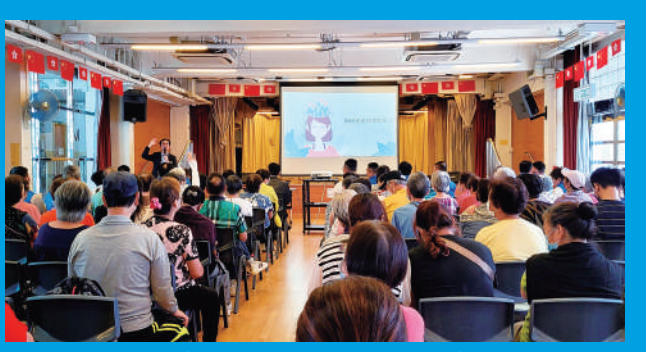
▲荃灣區關愛隊舉辦精神健康講座，邀請專業人士向居民講解常見的精神病，以及教授他們如何面對精神健康狀況。

關愛隊又舉辦不同關愛活動，讓居民融入社區，包括親子手工工作坊、長者義務剪髮、父親節拍攝家庭照活動、長者使用智能手機訓練班、慶祝回歸26周年活動等。