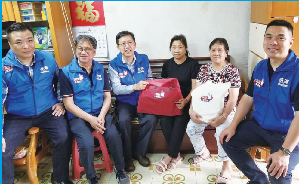
▲荃灣民政事務專員暨荃灣區關愛隊總指揮區家盛與荃灣區關愛隊探訪區內長者戶，建立聯繫及為他們提供基本服務。

2022年《施政報告》宣布在18區設立「地區服務及關愛隊伍」（關愛隊），以凝聚社區資源和力量，支援政府地區工作和加強地區網絡。荃灣及南區率先成立關愛隊，馬不停蹄為區內居民服務。