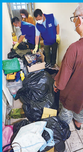
▶荃灣區關愛隊探梨木樹邨受火警影響居民，協助他們清理被燒毀的雜物。