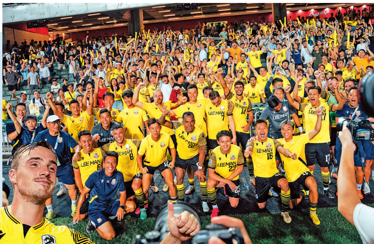
▲理文周三勝出亞冠外圍賽後，球員與入場支持的球迷大合照。