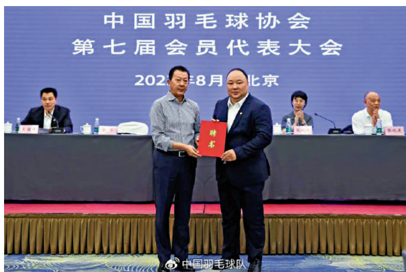
▲張軍(右)連任中國羽協主席，國家體育總局副局長李穎川向其頒發聘書。

【大公報訊】據新華社報道：中國羽毛球協會第七屆會員代表大會16日在北京召開，會議選舉產生新一屆中國羽毛球協會領導機構，張軍連任主席，國家體育總局副局長李穎川向其頒發聘書。