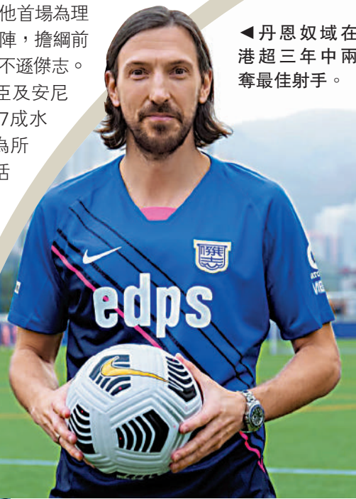
▲丹恩奴域在港超三年中兩奪最佳射手。