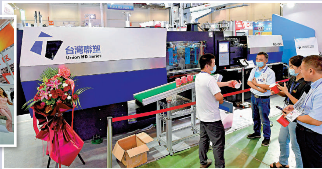
▲台灣海關部門公布的數據顯示，受惠於ECFA，至去年底台灣對大陸出口獲得減免關稅約94億美元。圖為廈門工博會上，客商在台灣企業展參觀交流。