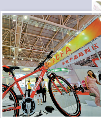
▲國台辦18日表示，支持依規研究中止或部分中止ECFA項下給予台灣產品的關稅優惠。