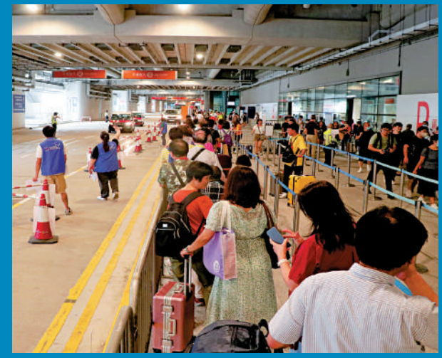
▲郵輪碼頭昨日一度出現逾三十人輪候的士。