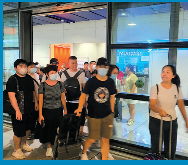
▲昨日下午約四時，離開碼頭的旅客達到高峰。