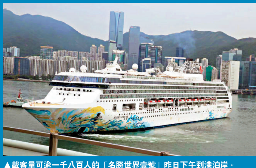
▲載容量可逾一千八百人的「名勝世界壹號」昨日下午到港泊岸。