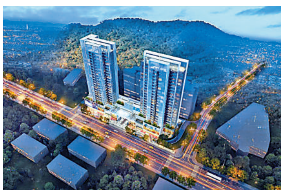
▲亞太·半山樾府由兩幢物業組成，提供180伙。

教育方面，項目鄰近龍園外國語實驗學校、草埔小學、新華外國語學校、羅湖教科院附屬學校及羅湖實驗學校等。商業方面，項目地處門戶核心，便捷暢達水貝商園、華潤筍崗新商園。生態方面，背靠銀湖山郊野公園約140萬平米原始森林，享受天然氧吧。