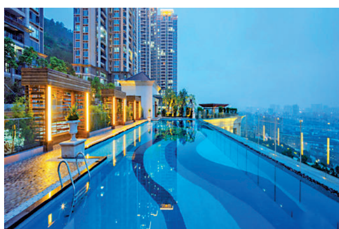
▲半山道1號居高臨下，享廣闊城市景和山景。