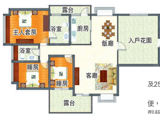
▲半山道1號141平米三房兩廳戶型圖。

要注意的是，由於屋苑位於半山，出行不太方便，自駕開車較適合，小區商舖比較少，需往其他大型超市。不過，住戶開車上清平高速，15分鐘到羅湖地王萬象商園，20分鐘到城市中心生活圈。