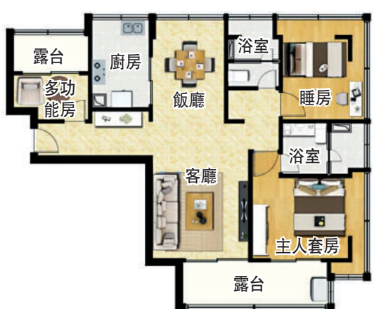
▲亞太·半山樾府96平米三房兩廳戶型圖。