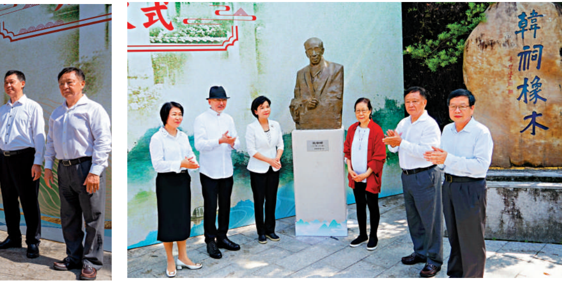
▲饒宗頤塑像在潮州韓文公祠揭幕。

作為莊世平和饒宗頤塑像的創作者，李象群表示：「很榮幸能為莊老、饒公創作雕塑，一位是愛國領袖、一位是國學巨擘，他們的光輝事跡感動了我。希望能夠通過我塑造的形象來感動觀眾，讓他們卓越的思想與精神在潮州乃至中華大