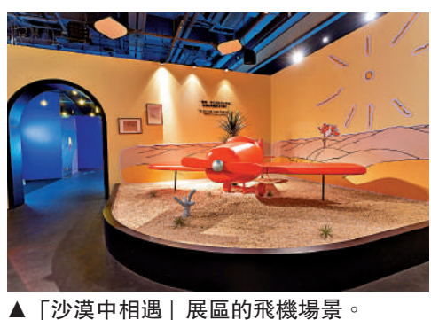
▲「沙漠中相遇」展區的飛機場景。