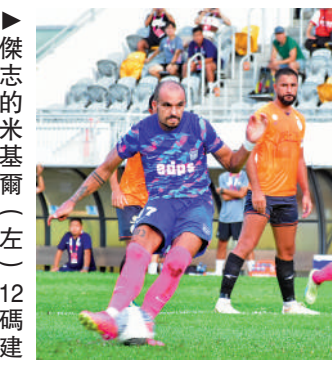
功。傑志的米基爾（左）12碼建功。