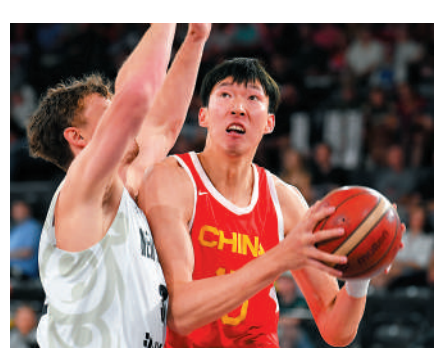
▲▼周琦（上圖右）和趙睿（下圖左）均隨同中國男籃在廣東深圳為即將到來的世界盃賽進行最後備戰。

【大公報訊】據中新社報道：周琦在中國男子籃球職業聯賽（CBA）中的歸宿終於塵埃落定，他將加盟廣東男籃，與另一國手、廣東男籃著名後衛趙睿互換東家。 在兩位中國籃球名將「互換東家」消息出爐後，新疆男籃第一時間做出回應。會方表示，作為一名優秀的國家隊球員，趙睿曾隨廣東隊3次獲得CBA總冠軍，2次當選CBA全明星最有價值球員，他的加盟必將提升球隊實力，為新疆球迷創造屬於新疆籃球更好的成績。同時，球隊亦感謝周琦為球隊奪得隊史首個CBA總冠軍作出的貢獻。