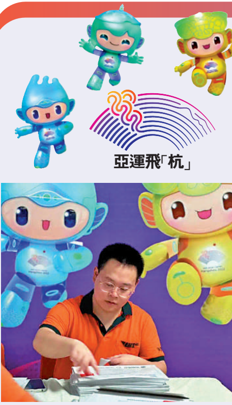
▲▼在票務中心內，一張張印有「第19屆亞洲運動會」字樣的紙質票新鮮出爐，杭州郵政公司工作人員將核對無誤後的門票進行掃描收寄。