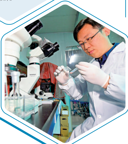
▲ 南京東南大學的研究人員在進行「心臟芯片」後續研究。