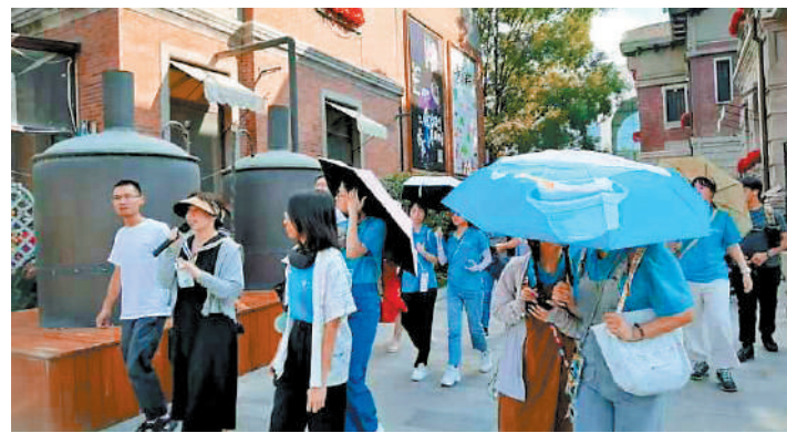
▲港生遊覽意式風情街，觀賞中西交融的建築藝術。

海河觀光遊船集中了天津遊的精華，一路上既可感受天津時代的變遷，也可欣賞到現代都市的摩登大廈。遊船路線途經天津站、意式風情街、天津之眼摩天輪、大悲院、解放橋等景點，但最吸引人的當屬建築風格獨特各異的橋樑。比如「天津之眼」融為一體的永樂橋、天津標誌性建築物之一——解放橋等，沿線共有「九橋十三景」，是遊覽天津省時省力又好看好拍的打卡點。