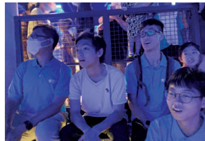
▲港生在天津國家海洋博物館觀看4D影片，學習深海知識。

多位港生在參觀結束後紛紛稱，此次參觀如同打開了一個嶄新的窗口，讓他們對海洋有了更加深入、立體的認識。通過如VR、AR等現代科技手段展現的展品深受喜愛，使得學習之旅既有趣又有實感。