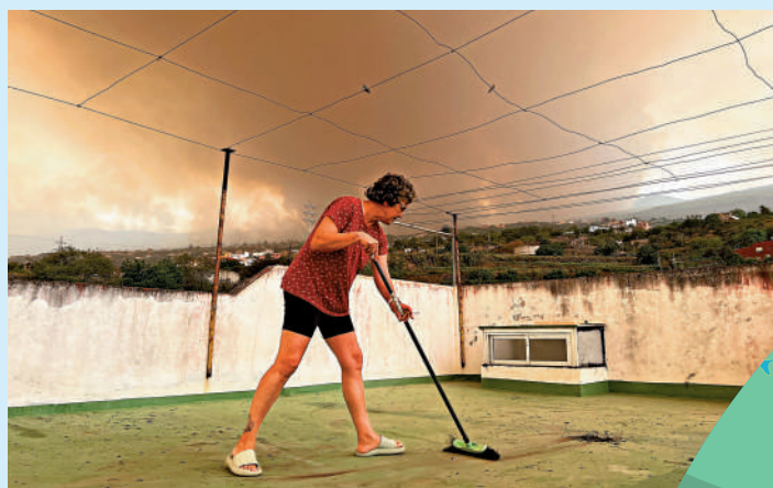
▲西班牙特內里費島居民19日清理山火造成的灰

據報道，今年加拿大山火已導致約13.7萬平方公里的土地被燒毀，相當於50個香港。加拿大跨機構森林消防中心稱，該國正經歷有史以來形勢最嚴峻的山火季，全國至少有1000處山火同時燃燒。專家表示，受氣候變化影響，炎熱乾燥天氣助長山火的風險不斷上升。