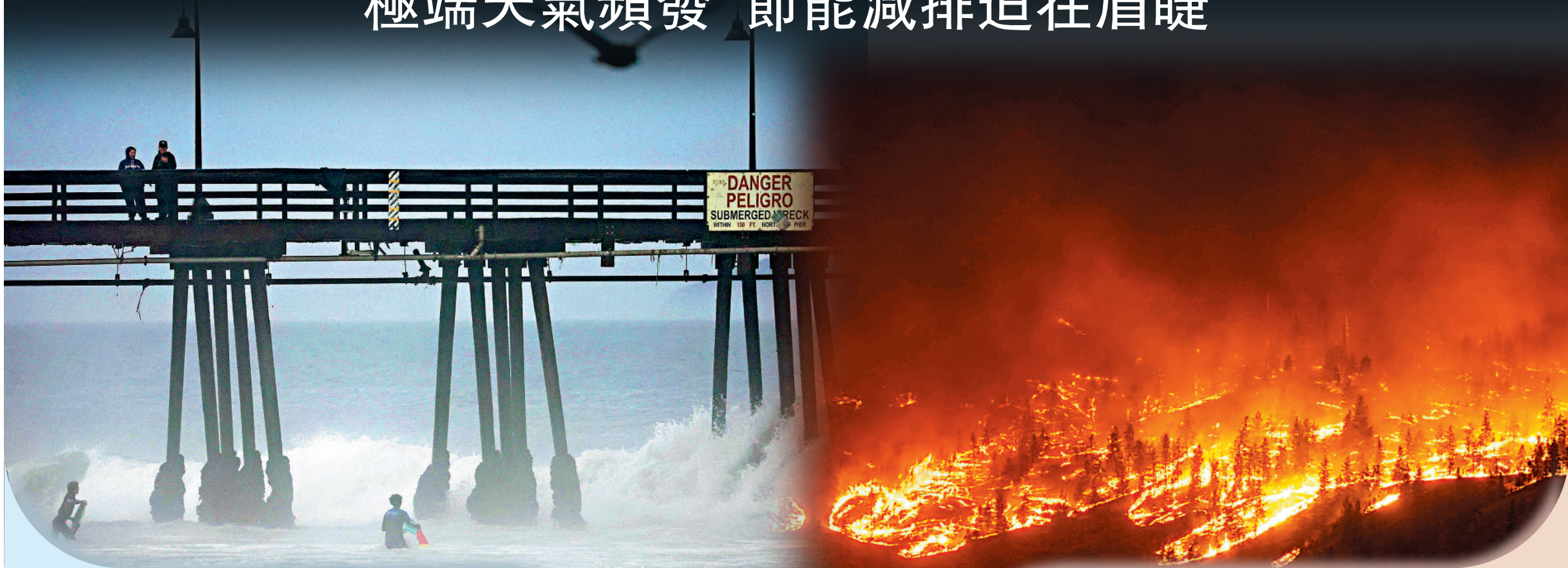
▲颶風「希拉里」來襲，加州海邊20日掀起風浪。