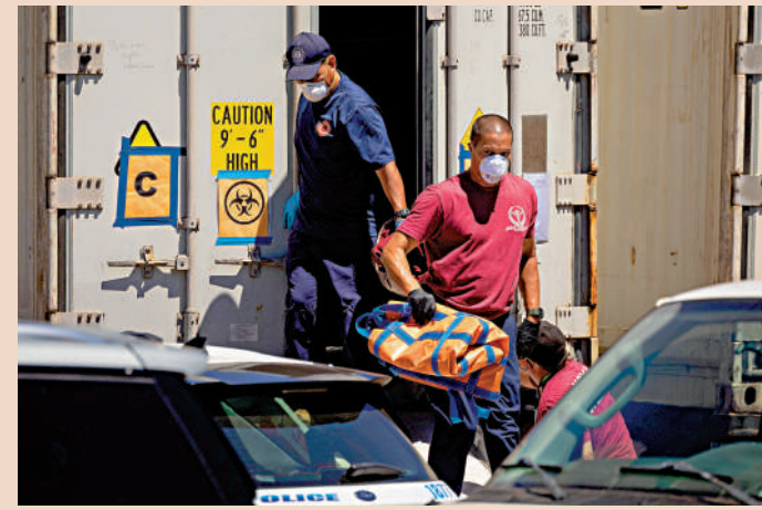
▲夏威夷山火遇難者的遺體被送入冷藏貨櫃。

戈德曼表示，判定遇難者的確切死因是燒傷、窒息還是溺水也是一項艱難的工作。火災發生時，不少人試圖跳海逃生，他們有可能喪身大海。