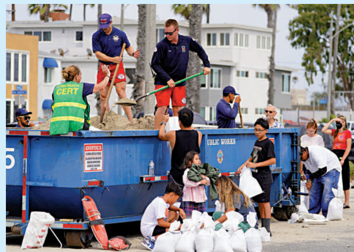
▲加州居民19日裝填沙袋，用於抵禦洪水。

當局在南加州各縣發放沙袋，居民們亦爭先恐後在自家門前築起防洪屏障。白宮方面稱，美國總統拜登已聽取關於應對颶風方案的簡報，並敦促所有受影響地區的居民小心防範。