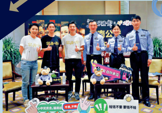
►濟南公安攜手《孤注一擲》劇組跨界聯動反詐，左三為導演申奧。

劇情：頭目「陸經理」（王傳君飾）將工廠分為八個小組，涉及炒股、挖幣、網頁、電商、博彩等