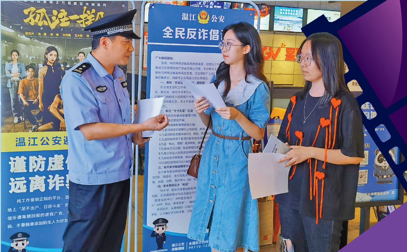
▲近日上映的反詐題材電影《孤注一擲》，引發觀影熱潮和廣泛討論。圖為成都溫江的公安民警走進影院，向市民科普反詐知識。