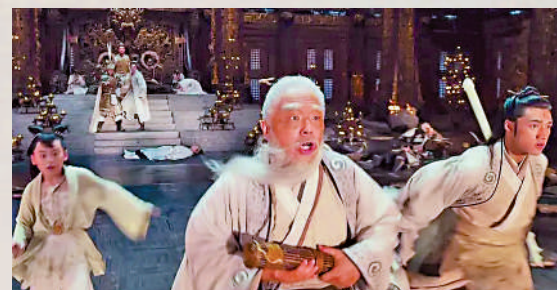
▲《封神第一部》的演員有前輩亦有新人，右二為黃渤飾演的姜子牙。