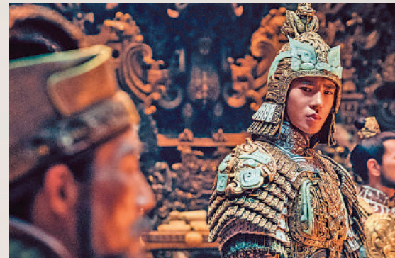
▲電影《封神第一部》朝堂戲有看點。