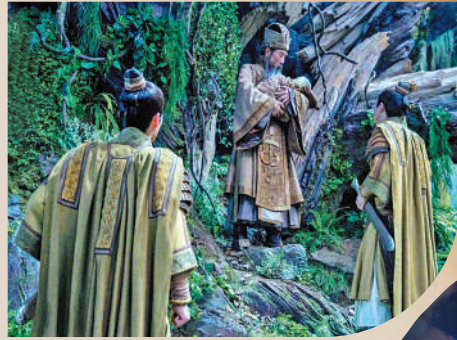
▲劇本加添了姬昌（中）收養雷震子的情節。