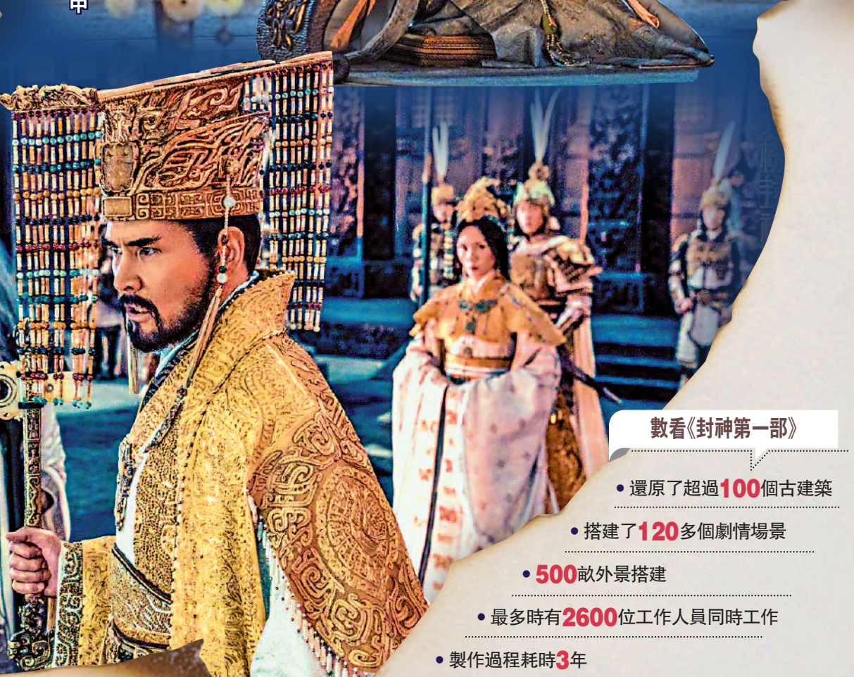
▲影片中不少特技鏡頭。

電影畫面構圖很精緻，值得一提的是，這部電影的藝術指導是香港電影美術指導葉錦添。在他的指導下，一幀幀畫面打造了一個中國的神話宇宙，以生動的電影構圖，展現了創作者對故事的理解。