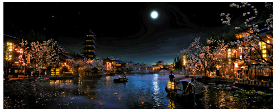
▲《長安三萬里》中的動畫構圖充滿中國詩意美學。

李白等人堅信「天生我材必有用」，但這恰恰是眾人悲劇的根源。唐代等級森嚴的階級制度，縱使如李白一樣的天縱狂才，卻也不得其門而入，終於還是流下了「世間道，走不下去」的辛酸淚；反觀高適，名將之後，高家槍舞得可上陣殺敵，卻連一位公主的歡心也討不來，最終還要憑藉亂世才能官拜三鎮節度使，真正印證了「文窮而後