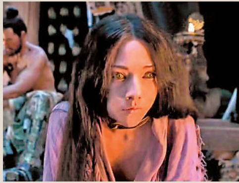
▲影片中的妲己（右）扮相。