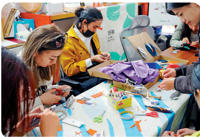
更多了解可持續概念。「好瓶HowBottle」線下活動，讓消費者

在「好瓶HowBottle」團隊眼中，不同數量的塑膠樽對應着不同的單品，3個瓶子等於一個抽繩包，12個瓶子等於一件T恤，24個瓶子等於一個背包……她們相信，「垃圾」與研發設計的相互融合，是環保領域的重要一環，最終會成為時尚的新寵。