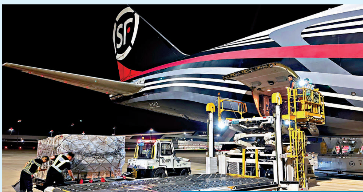
▲順豐正式遞表申請在港上市，聯席保薦人為高盛、華泰國際及摩根大通。

疫情期間，順豐A股的股價在2021年底至2022年初期間曾由高位72.67元跌至低見42.51元，但其後隨着中國經濟活動恢復，市場復甦，順豐的股價也由低位作出反彈，特別是在今年第一季，股價曾一度升見61.67元，近期股價則隨大市回落，但仍守穩在44元以上。