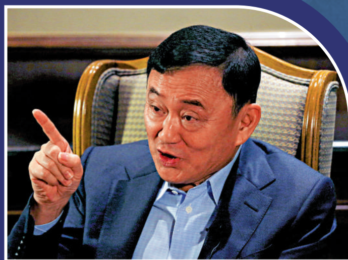
▲泰國前總理他信流亡海外17年，計劃今日返泰。

原為電信大亨的他信現年74歲，自2001年起任總理。2006年9月因軍事政變下台後，被控涉及貪腐等多項刑事案，被最高法院判處罪名成立，被判坐牢10年。為躲避牢獄之災，他從2008年起流亡海外。