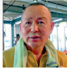
魚市場和尺先生：如果再排核污水入海，以後的生活只能是民不聊生！