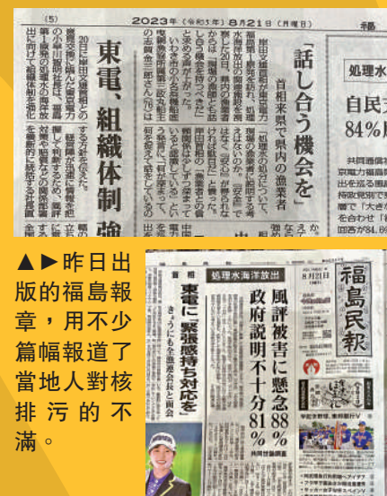
▲昨日出版的福島報章，用不少篇幅報道了當地人對核排污的不滿。