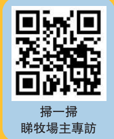
掃一掃 睇牧場主專訪