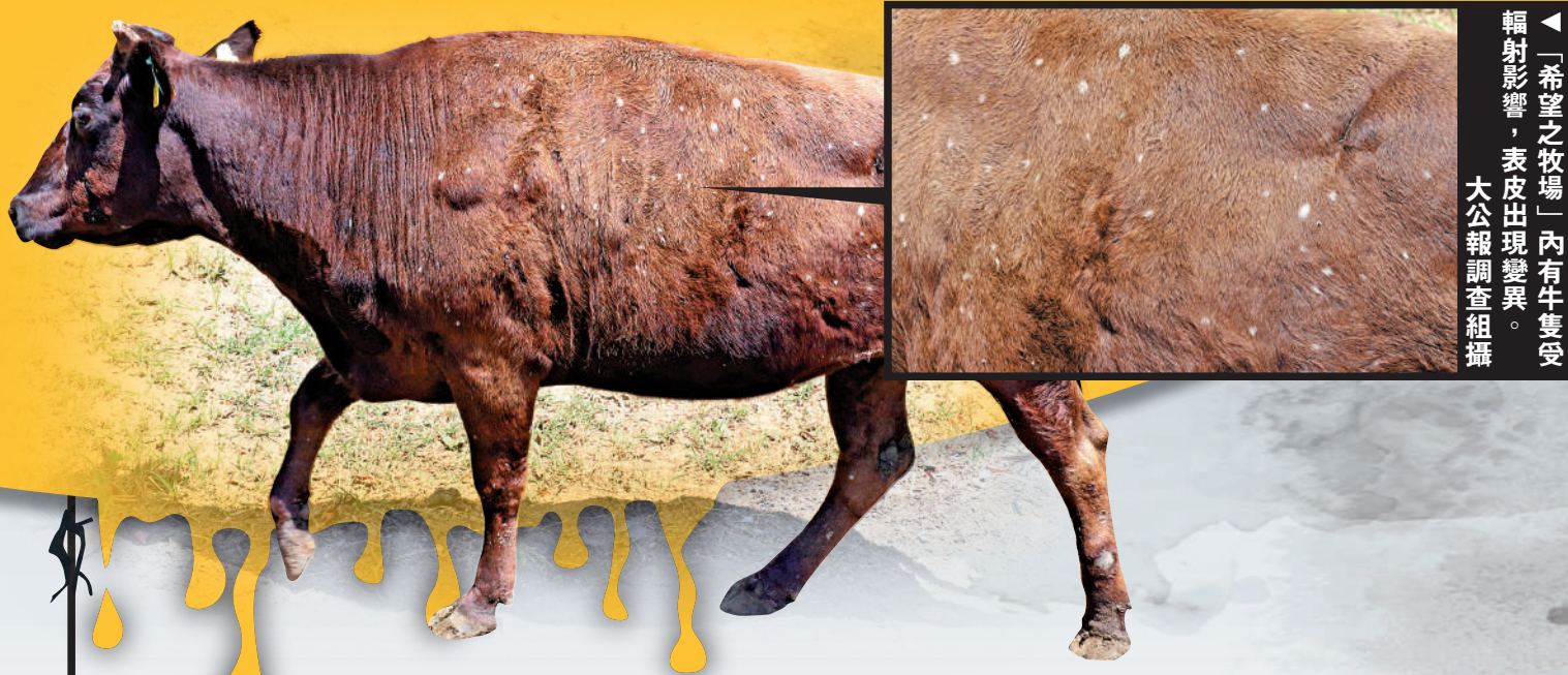
「希望之牧場」內有牛隻受輻射影響，表皮出現變異。