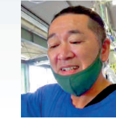
魚市場馬上先生：作為小市民只能走一步算一步。