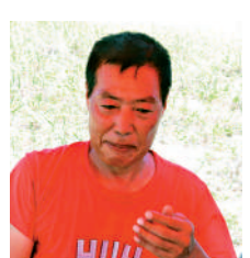
▲韓籍的韓先生表示，反對排核污水的團體正策劃全球行動。