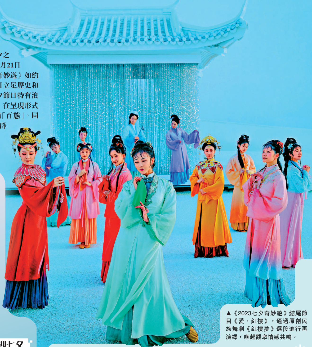
▲《2023七夕奇妙遊》結尾節目《愛·紅樓》，通過原創民族舞劇《紅樓夢》選段進行再演繹，喚起觀眾情感共鳴。