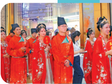
● 新人着唐裝完成婚禮儀式