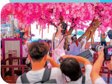
● 漢服愛好者相聚遊園會