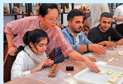
▲外國留學生學習製作果果，感受中國傳統七夕節民俗。

比如，牛郎織女故事在從中國傳播到亞洲其他國家時，也融入了當地風格。在日本牛郎織女故事中的竹子、木屐、草鞋等均帶有本民族特徵；朝鮮版本中，牛郎織女變成了王