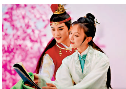
▲舞蹈演員舞姿優雅，用心演繹紅樓故事，引人入勝。

除了對「愛情」四個維度的詮釋，《2023七夕奇妙遊》還有特別驚喜——《愛·紅樓》，通過原創民族舞劇《紅樓夢》選段進行再演繹。移