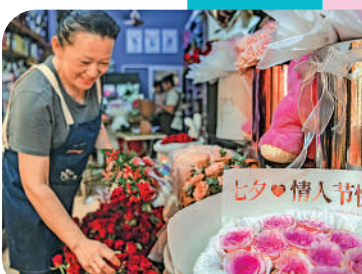
● 鮮花市場呈現銷勢頭