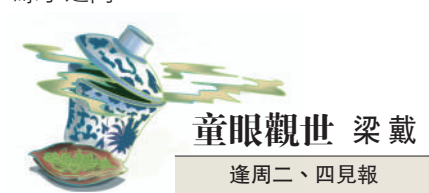
童眼觀世 梁戴 逢周二、四見報

往事悠悠，在韓文公祠建成千年以後，來自韓愈家鄉新密的百年橡木，讓潮州「韓祠橡木」景觀煥發生機；在饒宗頤題寫「韓祠橡木」多年以後，饒公塑像回到故里，與他錄寫的《韓木贊》「竹筒」長伴。文人與橡木，書法與塑像，就這樣融入青山綠水之間。