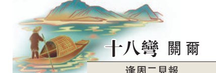
十八彎 關爾 逢周二見報

不妨將這種放空和漫遊，當作對享受當下的禮讚，對邂逅驚喜的期待，對率性而為的寵溺。學會在不慌不忙中，沉澱出生活的價值感，用最小的成本，獲得最大的自由。何樂而不為呢？