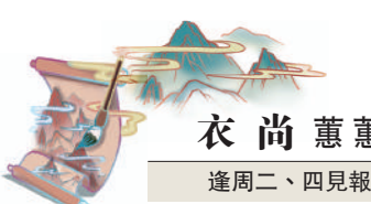
衣尚蕙蕙 逢周二、四見報

從流行趨勢上，T恤、衛衣從普通的日常衣着，發展到成為不少名牌的產品，現在已是時尚系列中一股不可缺少的力量，展現其平凡中見不平凡的魅力。