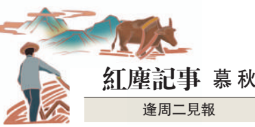
紅塵記事 慕秋 逢周二見報