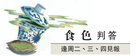
食色判答 逢周二、三、四見報