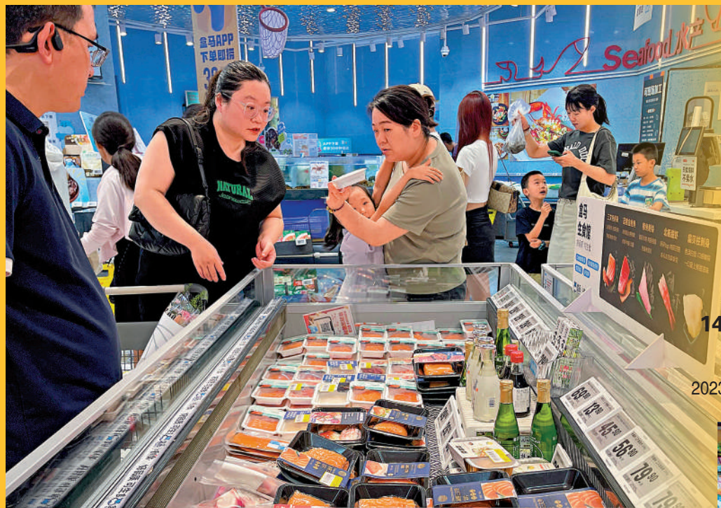
▲在鄭州一家大型商超內，顧客仔細查看海產品的生產地。