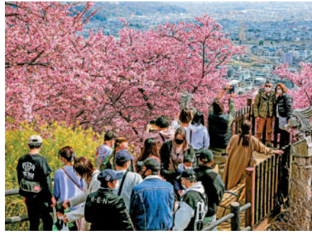
▲受日本核污水排海影響，部分遊客更改赴日旅遊計劃。圖為遊客在日本熱門景區賞花。

鄭州市民李先生也表示，本來近期考慮去日本旅遊，「現在打算放棄了，謹慎起見，還是離日本及附近海域遠一點的好。」大公報記者盧靜怡、劉蕊