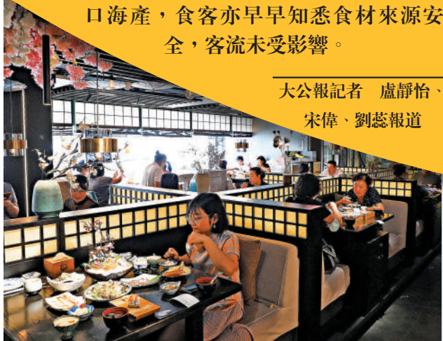
▲大連一家日料店早前已實現食材本土化，店內經營如常，座無虛席。