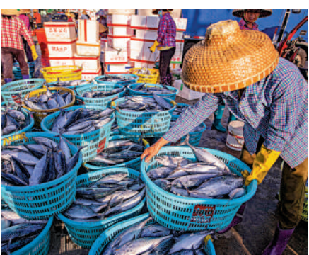
▲海南迎來開漁季，漁民在海南瓊海潭門港碼頭交易海魚。