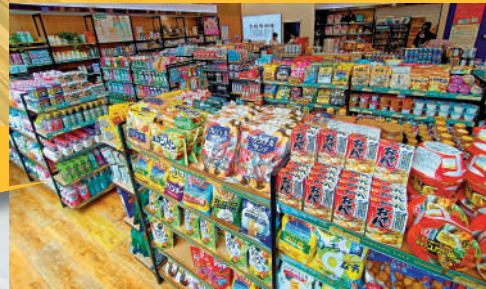
▲日本進口商品跨境連鎖超市內鮮有顧客光臨。