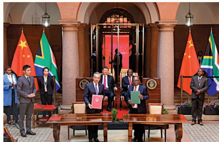
▲當地時間8月22日上午，中國國家主席習近平在比勒陀利亞總統府同南非總統拉馬福薩舉行會談。會談後，兩國元首共同見證簽署多項雙邊合作文件。

拉馬福薩表示，很榮幸接待習近平主席第四次對南非進行國事訪問。南中兩國都追求各自國家發展繁榮，在許多重大國際事務上擁有相同或相似立場。建交25年來，南非堅定恪守一個中國原則，雙方關係蓬勃發展，各層級交往密切，各領域合作成果豐碩。中國的投資與合作有力促進了南非經濟社會發展，對促進非洲國家和全球南方國家發展繁榮也發揮了至關重要的作用。南非高度評價中國共產黨帶領中國人民取得巨大發展成就，願同中方密切黨際交往，深化治黨治國理政經驗交流，開展中國式減貧試點合作，擴大貿易、投資、能源、基礎設施建設、製造業、科技等領域合作，歡迎更多中國企業來南非投資興業。