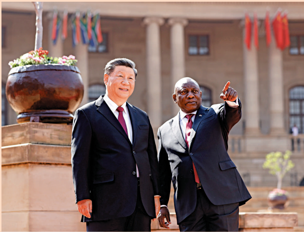
▲當地時間8月22日上午，中國國家主席習近平在比勒陀利亞總統府同南非總統拉馬福薩舉行會談。會談前，拉馬福薩為習近平舉行歡迎儀式。