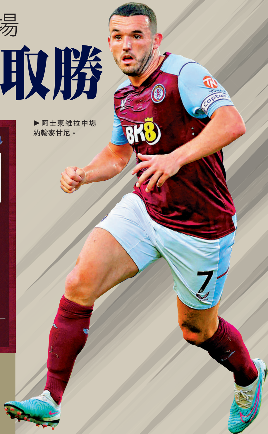
阿士東維拉中場約翰麥甘尼。