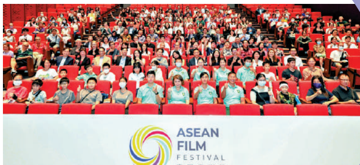
▲《娜娜的逝水年華》是今年電影節的壓軸放映活動。