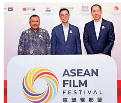
▲嘉賓出席東盟電影節2023壓軸活動。

香港特區政府文化體育及旅遊局局長楊潤雄出席當晚放映活動，他表示本次電影節將多元化的東南亞電影帶給香港觀眾，「促進文化交流，配合中央政府『十四五』規劃綱要將香港定位為『中外文化藝術交流中心』的策略性方向。特區政府致力向世界各地觀眾推廣香港電影業——我們的重要創意產業。我們鼓勵香港電影業界積極參與各類國際電影節，進一步加強與海外業界的聯繫，展示香港豐富的文化歷史和獨特的電影作品，維持香港於亞洲電影業的重要樞紐地位。」