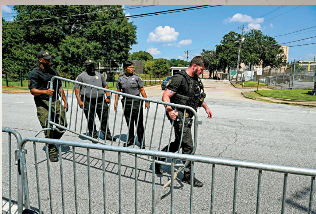
◀治安官21日在富爾頓縣監獄外設置路障，特朗普即將前往該監獄自首。

【大公報訊】綜合BBC、《紐約時報》報道：美國前總統特朗普將於當地時間24日，前往佐治亞州富爾頓監獄自首。富爾頓監獄素有「黑獄」之稱，不僅擁擠不堪、衛生惡劣，且不時發生囚犯離奇死亡事件。雖然特朗普已經與檢察官達成協議，繳納20萬美元（約156萬港元）保釋金，以免被關押，但他也將在該監獄辦理一系列的自首手續。