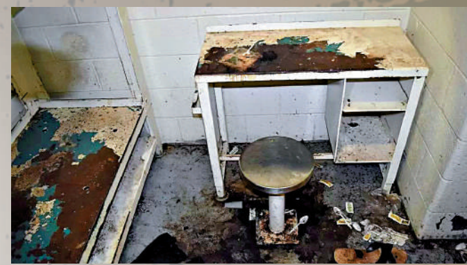
▲富爾頓縣監獄牢房衛生條件不堪入目。

8月14日，特朗普及另外18人因涉嫌試圖推翻佐治亞州2020年大選結果而被起訴。佐治亞州富爾頓縣檢察官威利斯表示，被告應在8月25日前自首。21日，特朗普表示將於24日前往佐治亞州富爾頓縣監獄自首，他已同意繳納20萬美元保釋金。