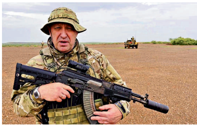
▲普里戈任傳墜機身亡。圖為他本月公開的視頻講話。法新社

【大公報訊】綜合法新社及CNN報道：香港時間24日凌晨1點半左右，塔斯社援引俄羅斯緊急情況部的消息稱，此前兵變失敗的僱傭兵組織「瓦格納集團」頭目普里戈任或墜機死亡。