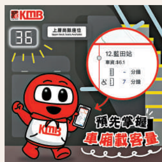
▲九巴試行在手機應用程式，顯示載客量，方便乘客知道將抵達班次的載客情況。

不少人搭巴士都希望有位坐，無奈不知道巴士的實際載客量。為提升乘車體驗，九巴試行在手機應用程式App1933，實時顯示車廂載客量，方便乘客知道即將抵達班次的載客情況。候車乘客只需觀察應用程式內到站時間旁邊的「間尺」圖案，就可以得知實時車廂載客量，若「間尺」圖案已填滿一半，代表車上載客情況為「半滿」。