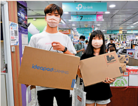
▲「黃金高登電腦嘉年華」昨日開鑼，有市民排隊搶購1元的手提電腦及特價產品。

另外，本周五和周六晚上6時至10時，嘉年華大會將連同欽州街、福華街、桂林街、福榮街鄰近電腦商場、零售商戶和食肆，舉行「數碼盛宴」周末夜市和「夜市大平賣」，逾800件商品售價低至五折。大會亦會提供免費燒豬或包點供市民享用，在黃金電腦商場及高登電腦商場消費的市民，可憑折扣卡到附近合作食肆獲得贈品或優惠。