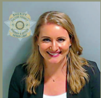
▲ 特朗普前律師埃利斯笑容滿面拍攝疑犯照。

• 除特朗普外，還有18名被告一同被起訴，包括前白宮幕僚長梅多斯、特朗普前律師朱利安尼、前司法部官員拉克等。