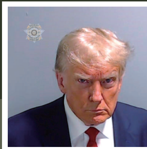
▶ 特朗普24日在佐治亞州富爾頓縣監獄拍攝本人首張疑犯照。