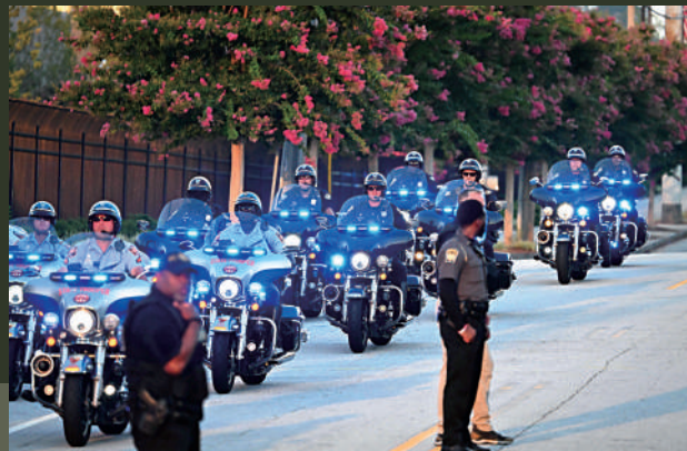
▶ 特朗普的車隊24日在佐治亞州警電單車隊護送下抵達監獄。

【大公報訊】綜合《紐約時報》、美聯社、路透社報道：當地時間24日，美國前總統特朗普向佐治亞州富爾頓縣監獄自首，他與另外18人因涉嫌試圖推翻美國2020年總統選舉佐治亞州結果被刑事指控。特朗普當天在監獄採集指紋，並拍攝了首張疑犯照。他堅稱自己被起訴是出於政治動機，一再強調自己沒有做錯。美媒稱，特朗普將每一次被控告都視作炒作機會，其疑犯照也迅速成為競選商品和道具。多宗官司纏身的特朗普目前在共和黨初選中支持率遙遙領先，再次暴露美式民主的荒謬。